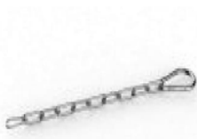
Łańcuch zabezpieczający ze stali nierdzewnej 304 (0,25; 1,0; 1,5; 5,0m)