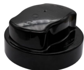
Osłona gniazda NEMA GL-A00-01