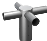
Adapter Quad GL-R03-15 [φ 90]