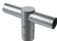
Adapter T GL-R03-06[φ 60] GL-R03-08[φ 76] GL-R03-08 A[φ 90]