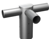
Adapter Triple GL-R03-14[φ 90]